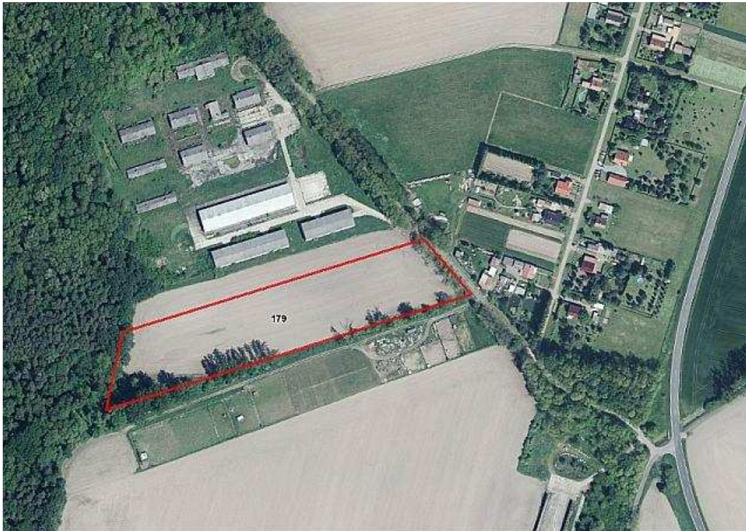
Geoinformationen © Bundesamt für Kartographie und Geodäsie ( www.bkg.bund.de ); © GeoBasis-DE / BKG (2017); Lageskizze