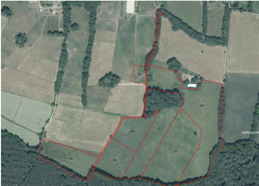
Gemarkungsgrenzen Basis: © Amt für Geoinformation und Vermessung der Länder Mecklenburg-Vorpommern, Niedersachsen, Brandenburg, Berlin, Sachsen-Anhalt, Sachsen, Thüringen; Geobasisdaten: © GeoBasis-DE / BKG (2021), Nutzungsbedingungen: http://sg.geodatenzentrum.de/web_public/nutzungsbedingungen.pdf ; © GeoBasis-DE / BKG 2018 (Daten verändert); www.bkg.bund.de; Lageskizze