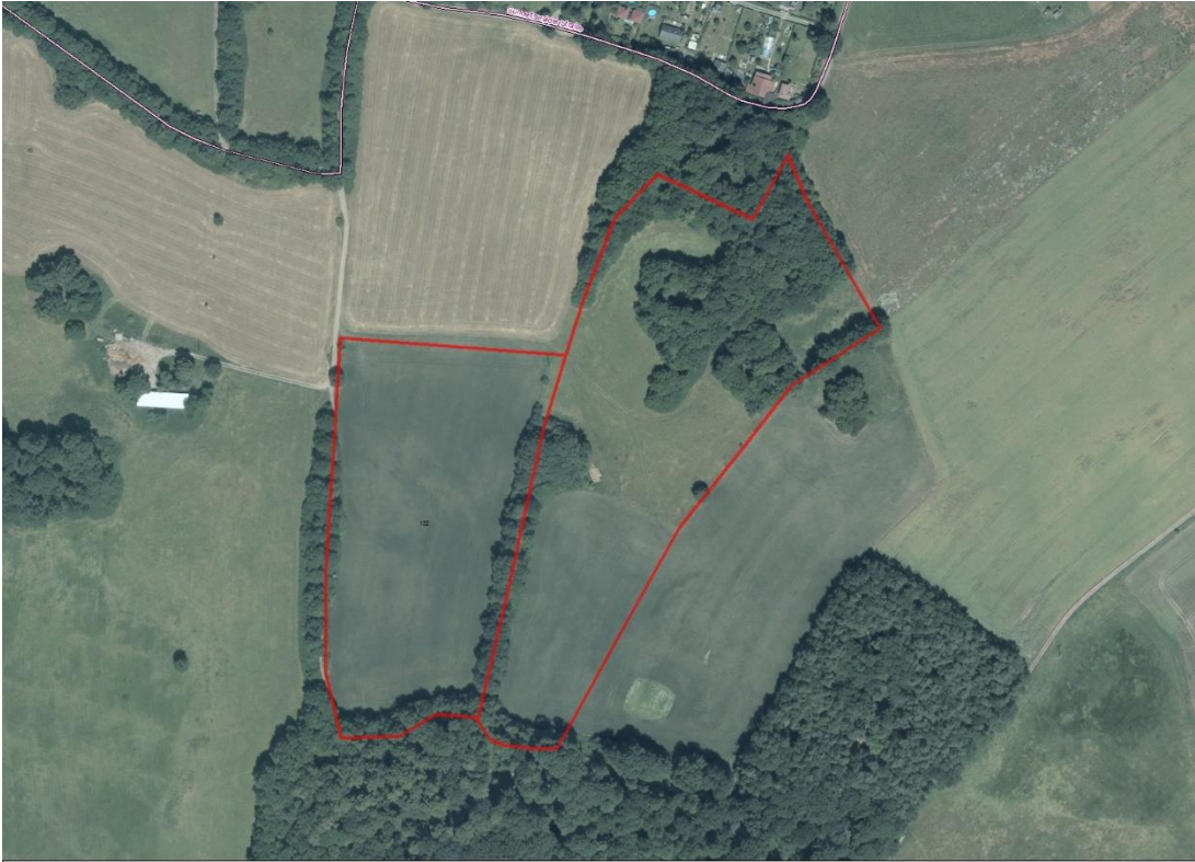
Geobasisdaten: © GeoBasis-DE / BKG (2021). Nutzungsbedingungen: http://sg.geodatenzentrum.de/web_public/nutzungsbedingungen.pdf . © GeoBasis-DE / BKG 2020 (Daten verändert), www.bkg.bund.de ; Lageskizze