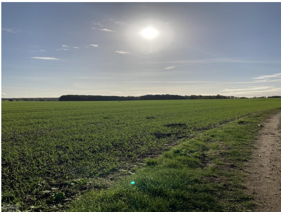
Blick auf die Flächen