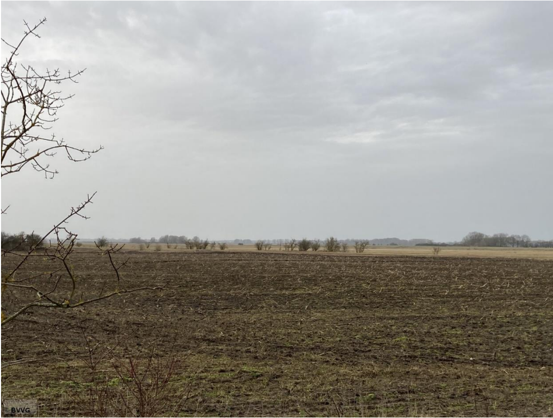
Blick auf das Ackerland