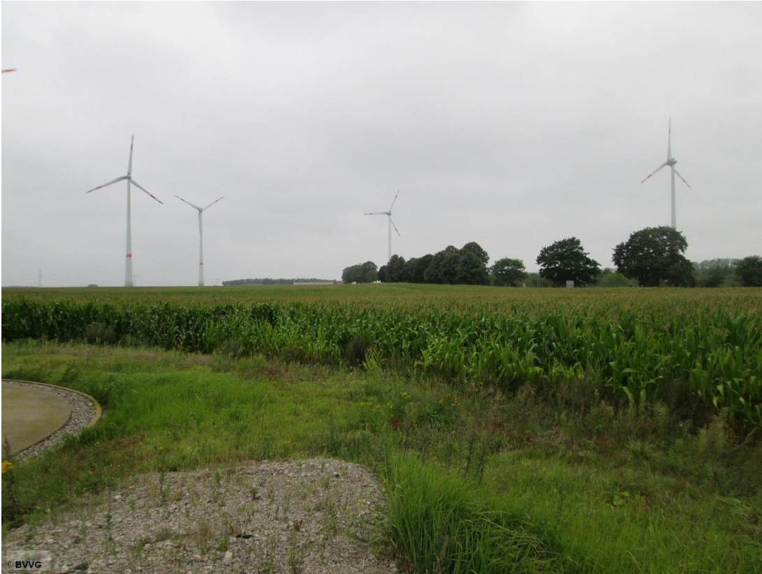
Blick auf die Fläche