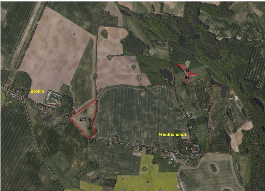
Teil der Ausschreibung

Lageskizze