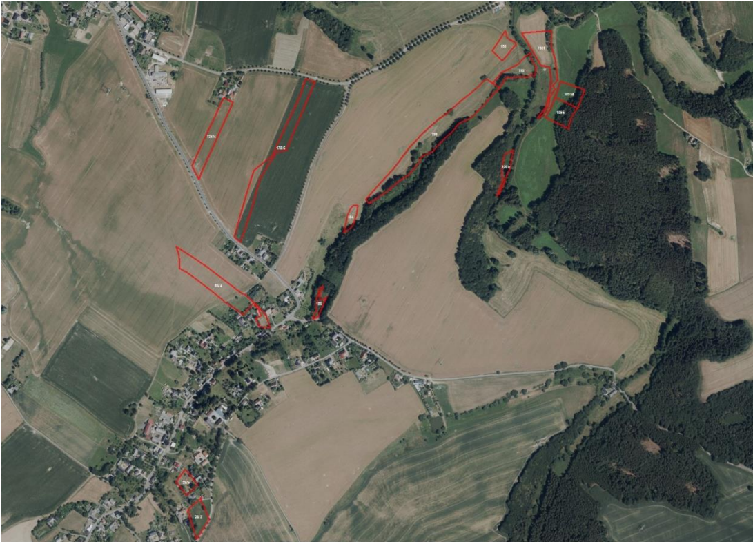
Geobasisdaten: © GeoBasis-DE / BKG (2021). Nutzungsbedingungen: http://sg.geodatenzentrum.de/web_public/nutzungsbedingungen.pdf . Lageskizze