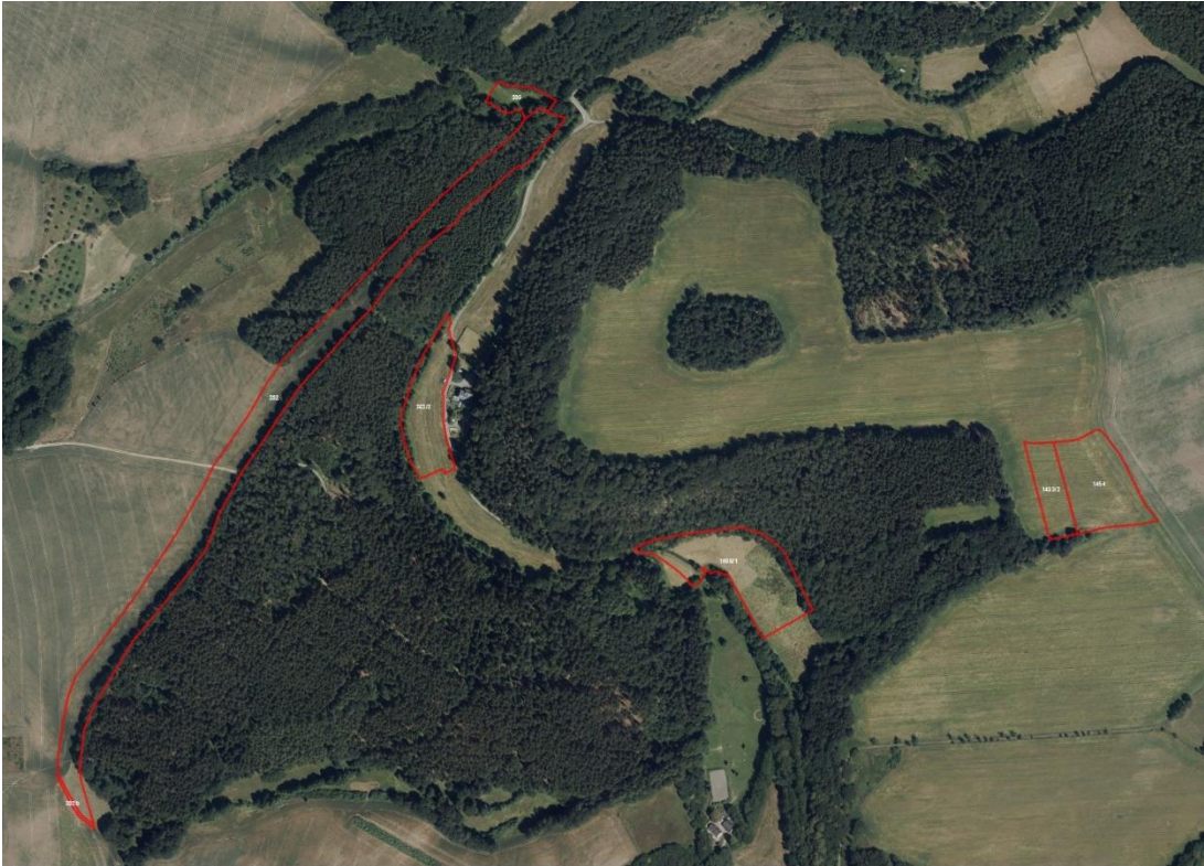
Geobasisdaten: © GeoBasis-DE / BKG (2021). Nutzungsbedingungen: http://sg.geodatenzentrum.de/web_public/nutzungsbedingungen.pdf . Lageskizze