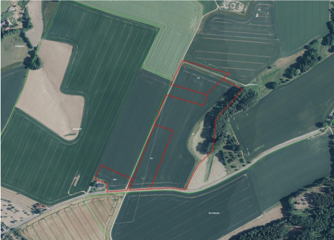
Gemarkungsgrenzen Basis: © Ämter für Geoinformation und Vermessung der Länder Mecklenburg-Vorpommern, Niedersachsen, Brandenburg, Berlin, Sachsen-Anhalt, Sachsen, Thüringen. Geobasisdaten: © GeoBasis-DE / BKG (2021), Nutzungsbedingungen: http://sg.geodatenzentrum.de/web_public/nutzungsbedingungen.pdf . © GeoBasis-DE / BKG 2018 (Daten verändert), www.bkg.bund.de , Lageskizze