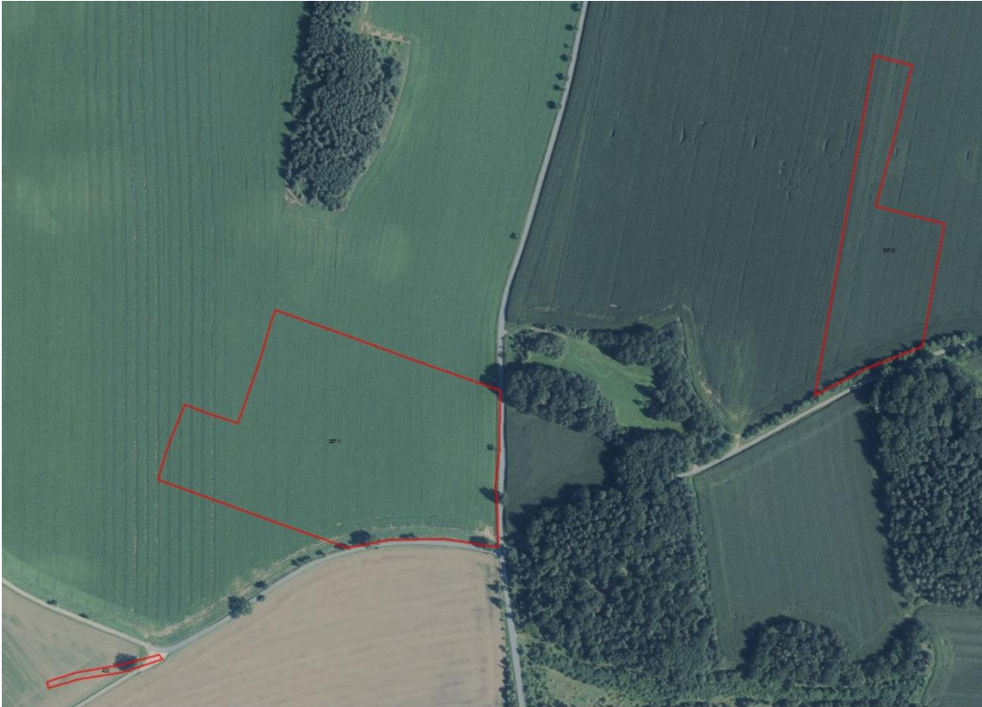
Geobasisdaten: © GeoBasis-DE / BKG (2021). Nutzungsbedingungen: http://sg.geodatenzentrum.de/web_public/nutzungsbedingungen.pdf . Lageskizze