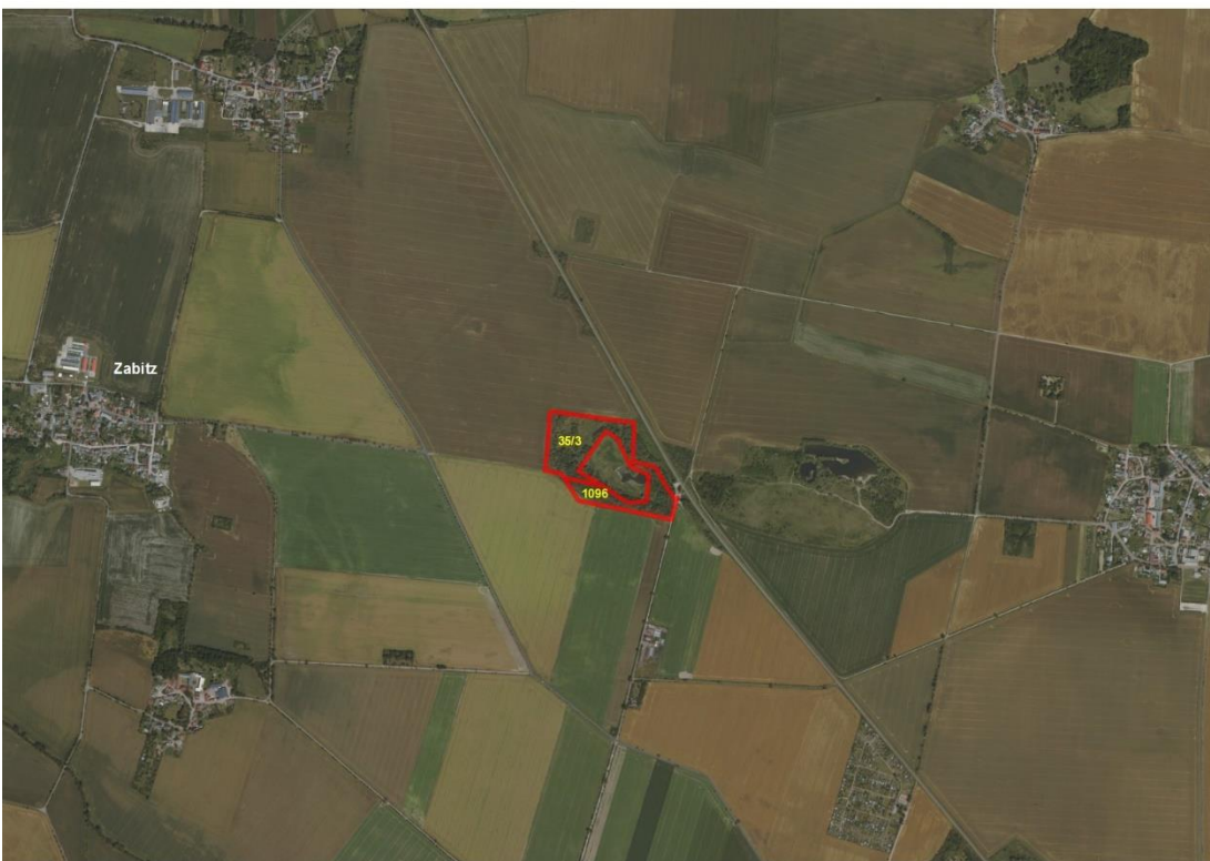
Gmk. Großpaschleben, Flur 1, FS 1096 u. Gmk. Zabitz, Flur 2, FS 35/3

Geobasisdaten: © GeoBasis-DE / BKG (2021). Nutzungsbedingungen: http://sg.geodatenzentrum.de/web_public/nutzungsbedingungen.pdf . © GeoBasis-DE / BKG 2018 (Daten verändert), www.bkg.bund.de ; Lageskizze