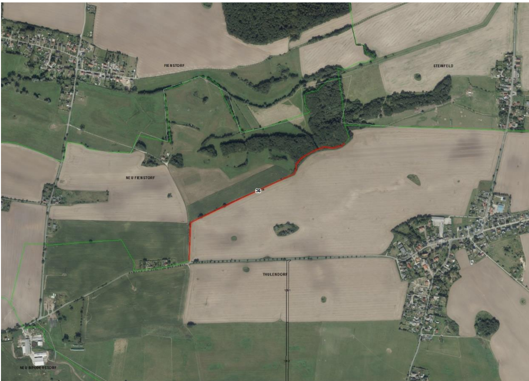
Gemarkungsgrenzen Basis. © Amt für Geoinformation und Vermessung der Länder Mecklenburg-Vorpommern, Niedersachsen, Brandenburg, Berlin, Sachsen-Anhalt, Sachsen, Thüringen, Geobasisdaten: © GeoBasis-DE / BKG (2021), Nutzungsbedingungen: http://sg.geodatenzentrum.de/web_public/nutzungsbedingungen.pdf , © GeoBasis-DE / BKG 2018 (Daten verändert), www.bkg.bund.de, © GeoBasis-DE/M-V 2020, Lageskizze