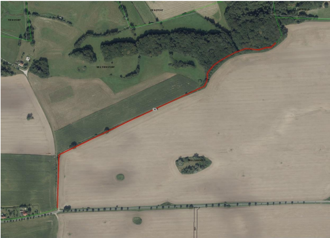
Gemarkungsgrenzen Basis. © Amt für Geoinformation und Vermessung der Länder Mecklenburg-Vorpommern, Niedersachsen, Brandenburg, Berlin, Sachsen-Anhalt, Sachsen, Thüringen, Geobasisdaten: © GeoBasis-DE / BKG (2021), Nutzungsbedingungen: http://sg.geodatenzentrum.de/web_public/nutzungsbedingungen.pdf , © GeoBasis-DE / BKG 2018 (Daten verändert), www.bkg.bund.de, © GeoBasis-DE/M-V 2020, Lageskizze