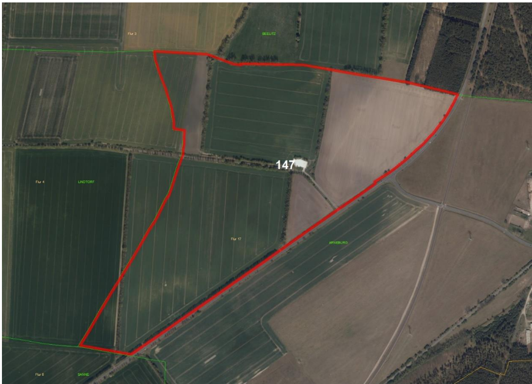
Gemarkungsgrenzen Basis: © Ämter für Geoinformation und Vermessung der Länder Mecklenburg-Vorpommern, Niedersachsen, Brandenburg, Berlin, Sachsen-Anhalt, Sachsen, Thüringen; Geobasisdaten: © GeoBasis-DE / BKG (2021). Nutzungsbedingungen: http://sg.geodatenzentrum.de/web_public/nutzungsbedingungen.pdf ; © GeoBasis-DE / BKG 2018 (Daten verändert); www.bkg.bund.de ; Lageskizze