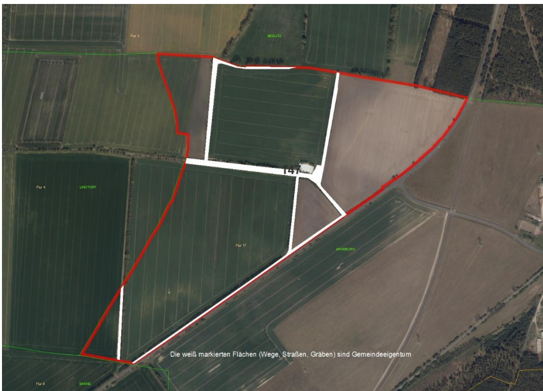
Objektflurstück Luftbild 1

Gemarkungsgrenzen Basis: © Ämter für Geoinformation und Vermessung der Länder Mecklenburg-Vorpommern, Niedersachsen, Brandenburg, Berlin, Sachsen-Anhalt, Sachsen, Thüringen; Geobasisdaten: © GeoBasis-DE / BKG (2021), Nutzungsbedingungen: http://sg.geodatenzentrum.de/web_publicnutzungbedingungen.pdf , © GeoBasis-DE / BKG 2018 (Daten verändert), www.bkg.bund.de; Lageskizze