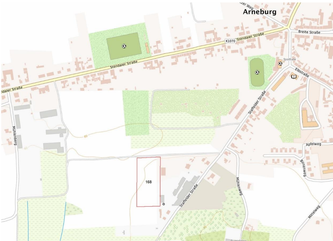
topogr. Karte 1

© Bundesamt für Kartographie und Geodäsie (2020), Datenquellen: http://sg.geodatenzentrum.de/web_public/Datenquellen_TopPlus.pdf , © GeoBasis-DE / BKG 2018 (Daten verändertert), www.bkg.bund.de , Lageskizze