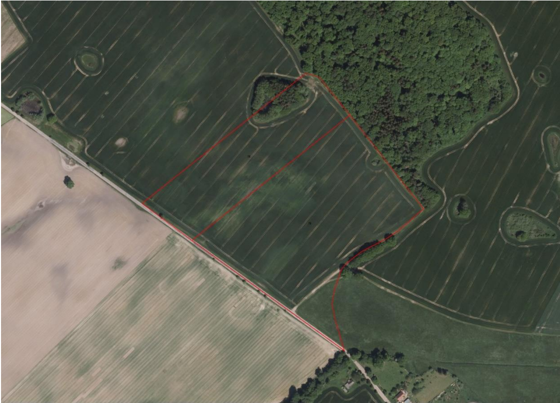
Geobasisdaten: © GeoBasis-DE / BKG (2020), Nutzungsbedingungen: http://sg.geodatenzentrum.de/web_public/nutzungsbedingungen.pdf . © GeoBasis-DE / BKG 2018 (Daten verändert), www.bkg.bund.de ; Lageskizze