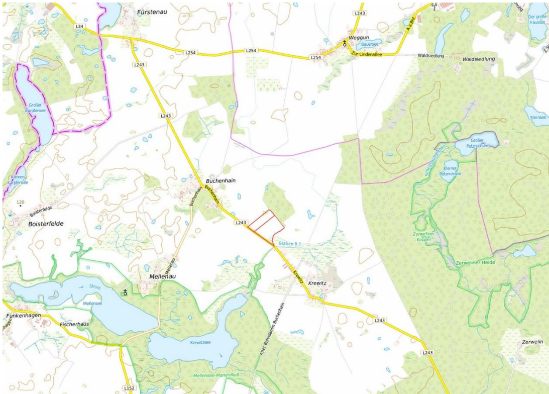
© Bundesamt für Kartographie und Geodäsie (2020), Datenquellen: http://sg.geodatenzentrum.de/web_public/Datenquellen_TopPlus.pdf . © GeoBasis-DE / BKG 2018 (Daten verändert), www.bkg.bund.de , Lageskizze