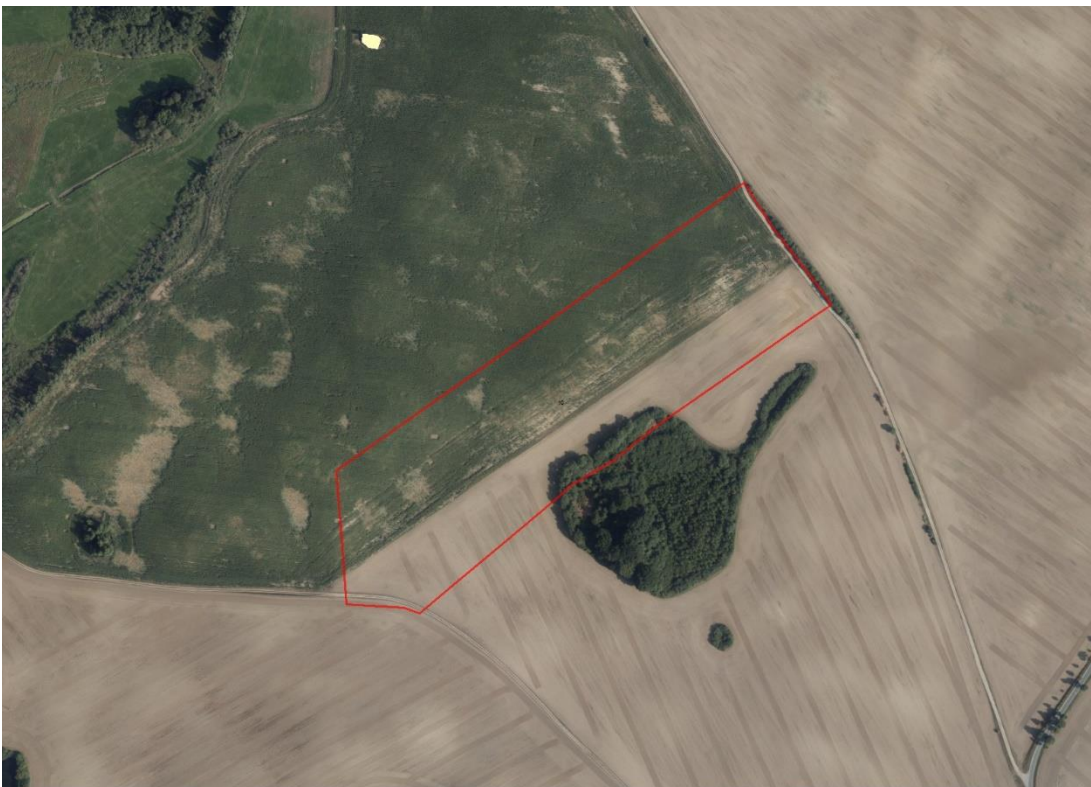
Luftbild der BVVG

Geobasisdaten: © GeoBasis-DE / BKG (2021). Nutzungsbedingungen: http://sg.geodatenzentrum.de/web_public/nutzungsbedingungen.pdf . Datenlizenz Deutschland - © GeoBasis-DE/LGB. Lageskizze