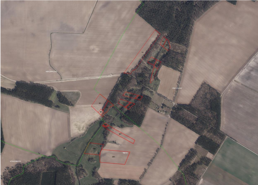
Gemarkungsgrenzen Basis. © Amt für Geoinformation und Vermessung der Länder Mecklenburg-Vorpommern, Niedersachsen, Brandenburg, Berlin, Sachsen-Anhalt, Sachsen, Thüringen. Geobasisdaten: © GeoBasis-DE / BKG (2021). Nutzungsbedingungen: http://sg.geodatenzentrum.de/web_public/nutzungsbedingungen.pdf . © GeoBasis-DE / BKG 2018 (Daten verändert). www.bkg.bund.de . Lageskizze