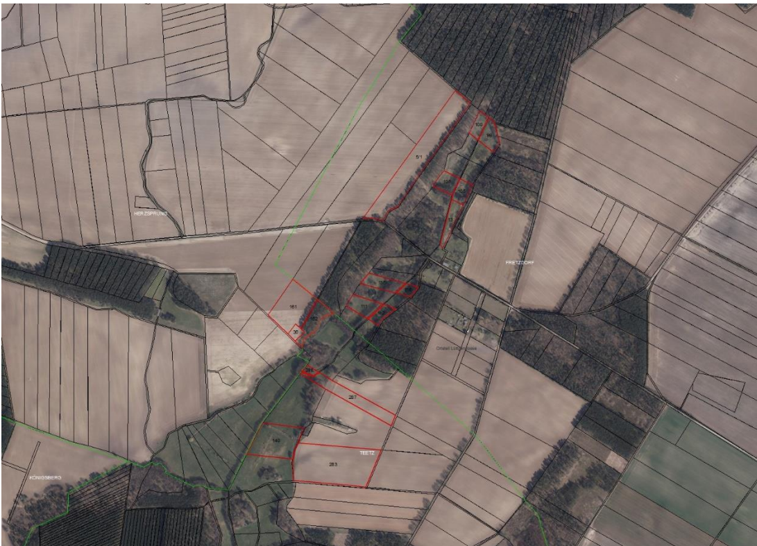
Gemarkungsgrenzen Basis. © Amt für Geoinformation und Vermessung der Länder Mecklenburg-Vorpommern, Niedersachsen, Brandenburg, Berlin, Sachsen-Anhalt, Sachsen, Thüringen. Geobasisdaten: © GeoBasis-DE / BKG (2021). Nutzungsbedingungen: http://sg.geodatenzentrum.de/web_public/nutzungsbedingungen.pdf . © GeoBasis-DE / BKG 2018 (Daten verändert). www.bkg.bund.de . Datenlizenz Deutschland - © GeoBasis-DE/LGB. Lageskizze