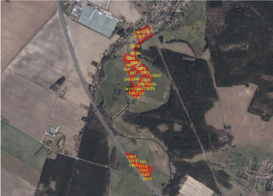
Geobasisdaten: © GeoBasis-DE / BKG (2021). Nutzungsbedingungen: http://sg.geodatenzentrum.de/web_public/nutzungsbedingungen.pdf . © GeoBasis-DE / BKG 2018 (Daten verändert), www.bkg.bund.de ; Lageskizze