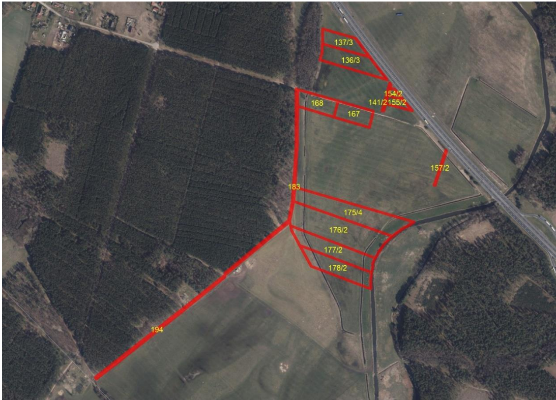
Geobasisdaten: © GeoBasis-DE / BKG (2021). Nutzungsbedingungen: http://sg.geodatenzentrum.de/web_public/nutzungsbedingungen.pdf . © GeoBasis-DE / BKG 2018 (Daten verändert), www.bkg.bund.de ; Lageskizze