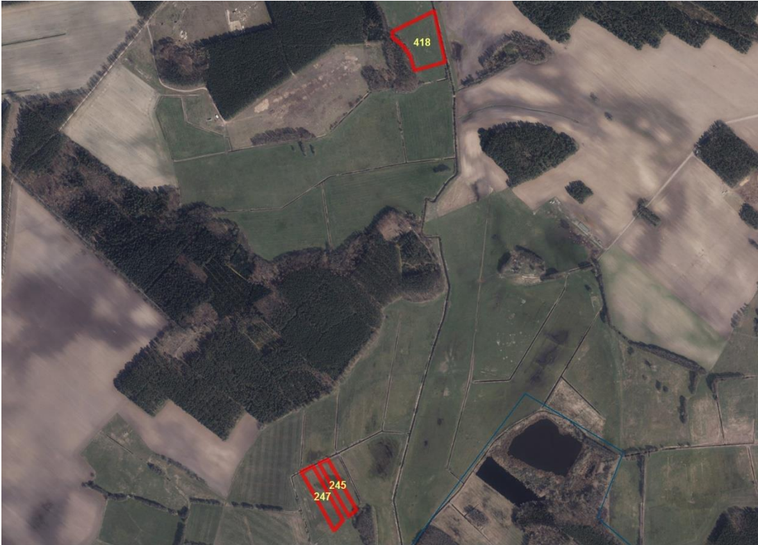
Geobasisdaten: © GeoBasis-DE / BKG (2021). Nutzungsbedingungen: http://sg.geodatenzentrum.de/web_public/nutzungsbedingungen.pdf . © GeoBasis-DE / BKG 2018 (Daten verändert), www.bkg.bund.de . Lageskizze