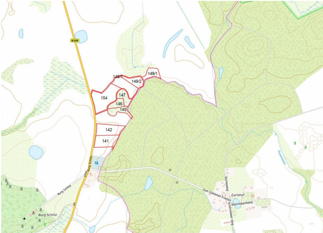
© Bundesamt für Kartographie und Geodäsie (2021). Datenquellen: http://sg.geodatenzentrum.de/web_public/Datenquellen_TopPlus.pdf . © GeoBasis-DE / BKG 2018 (Daten verändert). www.bkg.bund.de . Lageskizze