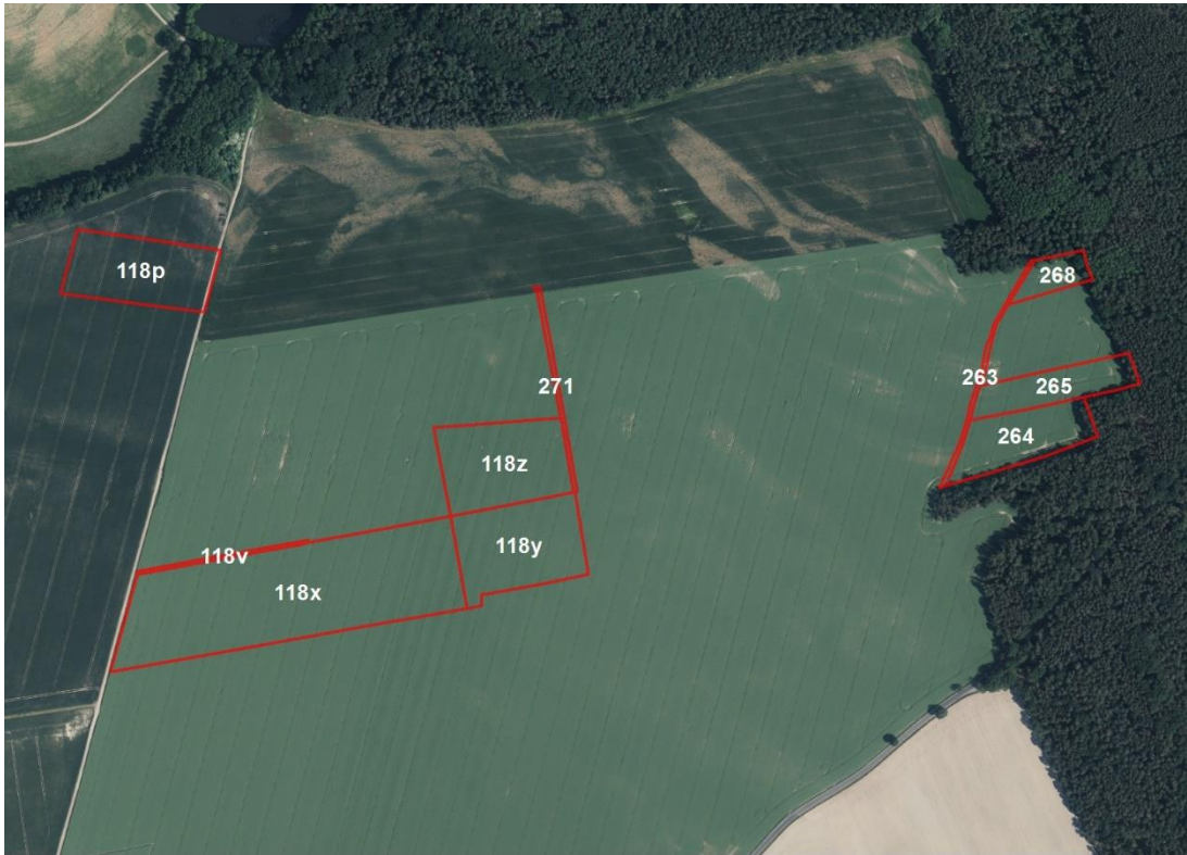
Geobasisdaten: © GeoBasis-DE / BKG (2021). Nutzungsbedingungen: http://sg.geodatenzentrum.de/web_public/nutzungsbedingungen.pdf . © GeoBasis-DE / BKG 2018 (Daten verändert), www.bkg.bund.de ; Lageskizze