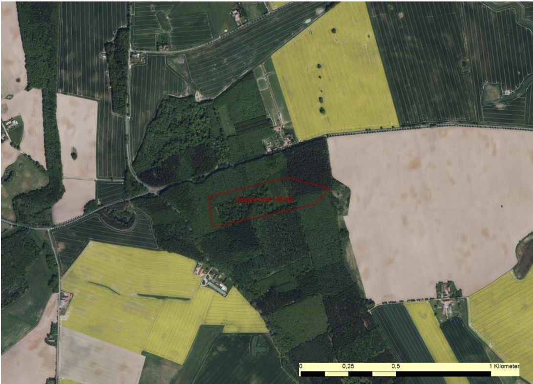
Geobasisdaten: © GeoBasis-DE / BKG (2020), Nutzungsbedingungen: http://sg.geodatenzentrum.de/web_public/nutzungsbedingungen.pdf , © Digitale Berechtsamsdaten der Bergbehörden (BB, MV, SN, ST, TH); © GeoBasis-DE / BKG 2018 (Daten verändertert), www.bkg.bund.de Befliegung vom 31.05.2018