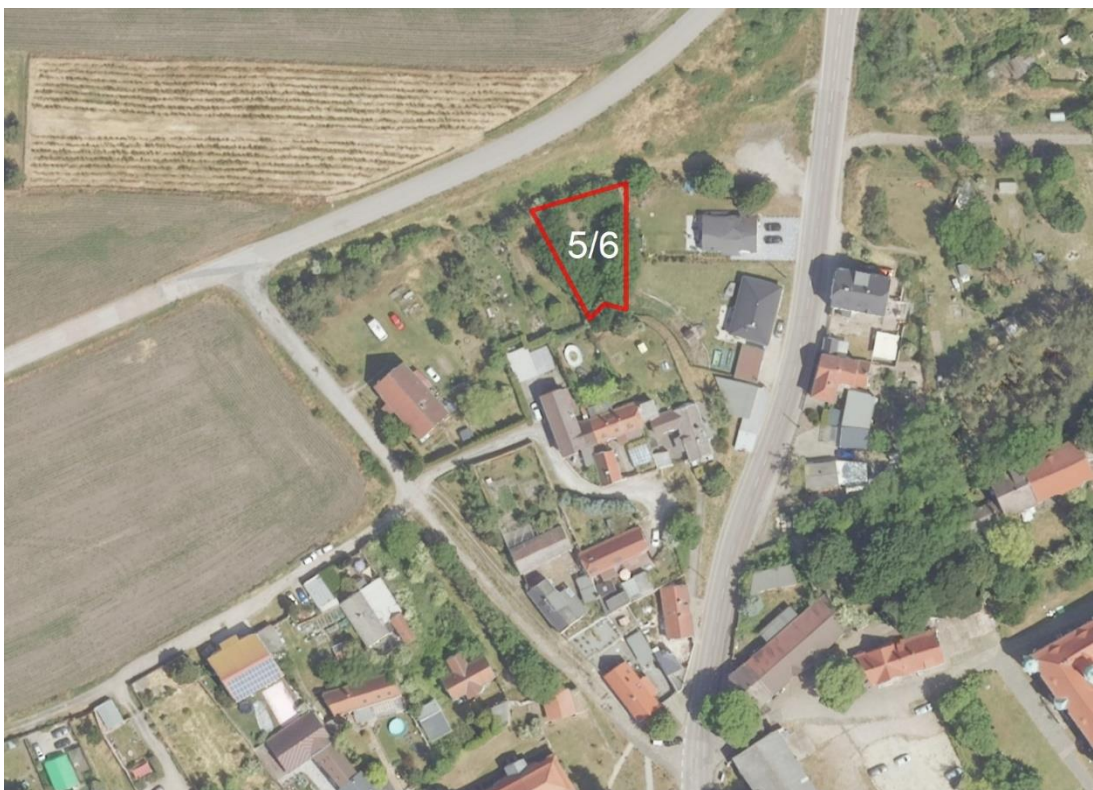
Übersichtskarte Frankleben und Neumark

Lageskizze