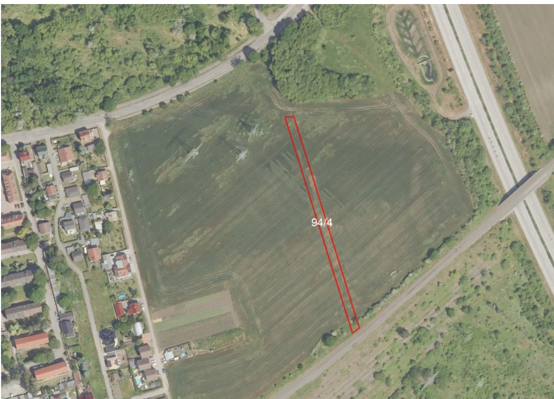
Detailansicht Frankleben Flur 7

Geobasisdaten: © GeoBasis-DE / BKG (2026). Nutzungsbedingungen: http://sg.geodatenzentrum.de/web_public/nutzungsbedingungen.pdf . © GeoBasis-DE / BKG 2018 (Daten verändert). www.bkg.bund.de . Lageskizze