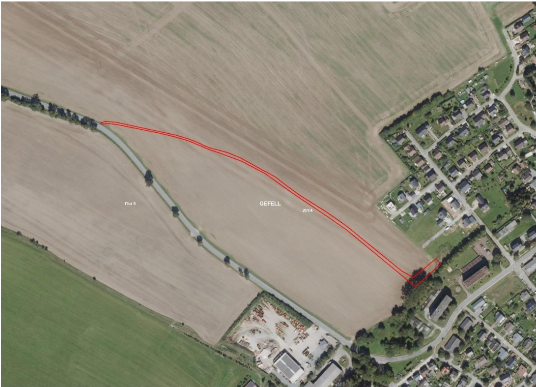
Gemarkungsgrenzen Basis: © Ämter für Geoinformation und Vermessung der Länder Mecklenburg-Vorpommern, Niedersachsen, Brandenburg, Berlin, Sachsen-Anhalt, Sachsen, Thüringen; Geobasisdaten © GeoBasis-DE / BKG (2026). Nutzungsbedingungen: http://sg.geodatenzentrum.de/web_public/nutzungsbedingungen.pdf , © GeoBasis-DE / BKG 2018 (Daten verändert), www.bkg.bund.de, Lage-skizze