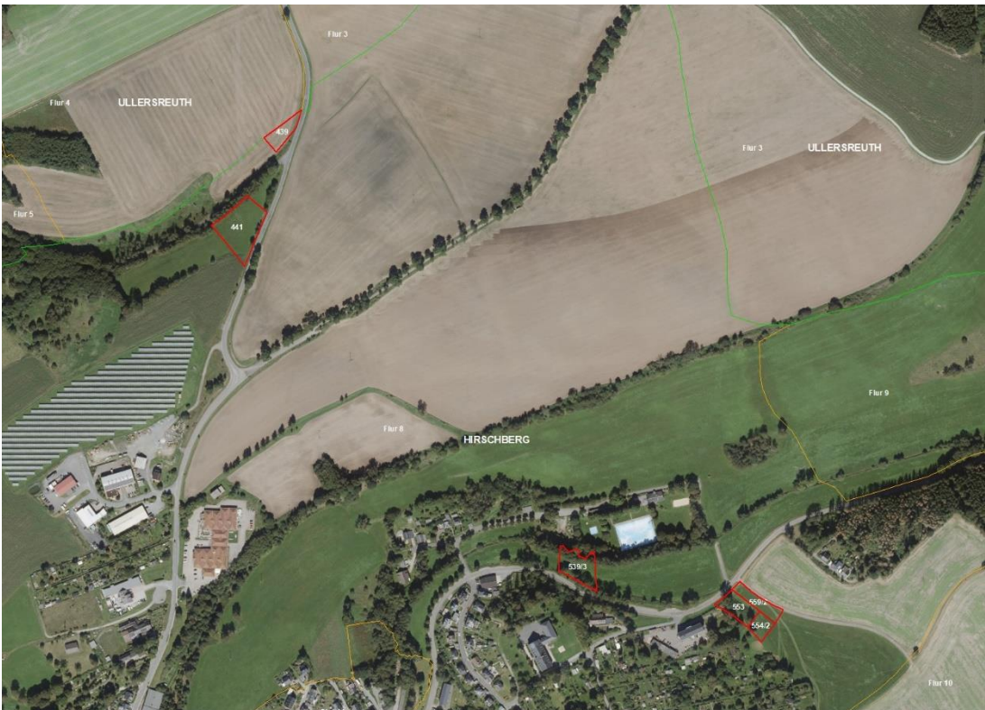
Gemarkung Hirschberg, Gefell, Flur 8 und 6

Gemarkungsgrenzen Basis: © Ämter für Geoinformation und Vermessung der Länder Mecklenburg-Vorpommern, Niedersachsen, Brandenburg, Berlin, Sachsen-Anhalt, Sachsen, Thüringen; Geobasisdaten: © GeoBasis-DE / BKG (2026). Nutzungsbedingungen: http://sg.geodatenzentrum.de/web_public/nutzungsbedingungen.pdf ; © GeoBasis-DE / BKG 2018 (Daten verändert); www.bkg.bund.de ; Lageskizze