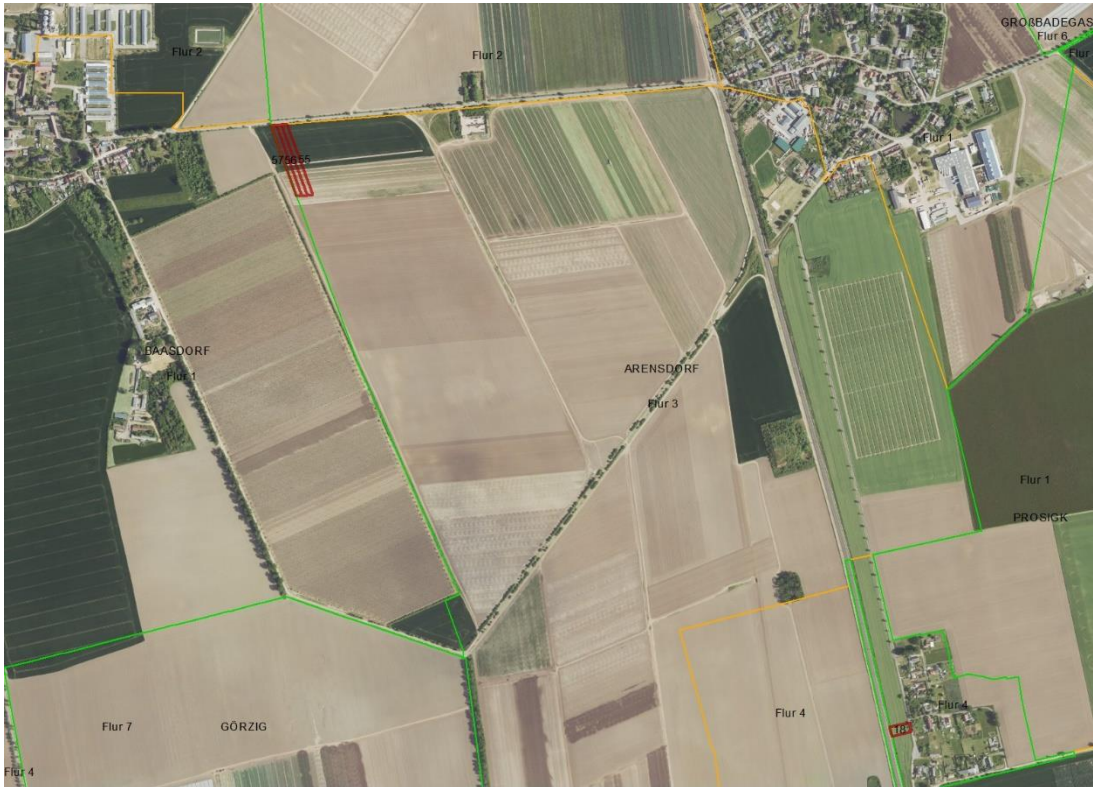
Gemarkungsgrenzen Basis: © Ämter für Geoinformation und Vermessung der Länder Mecklenburg-Vorpommern, Niedersachsen, Brandenburg, Berlin, Sachsen-Anhalt, Sachsen, Thüringen; Geobasisdaten: © GeoBasis-DE / BKG (2026). Nutzungsbedingungen: http://sg.geodatenzentrum.de/web_public/nutzungsbedingungen.pdf ; © GeoBasis-DE / BKG 2018 (Daten verändert); www.bkg.bund.de ; Lage-skizze