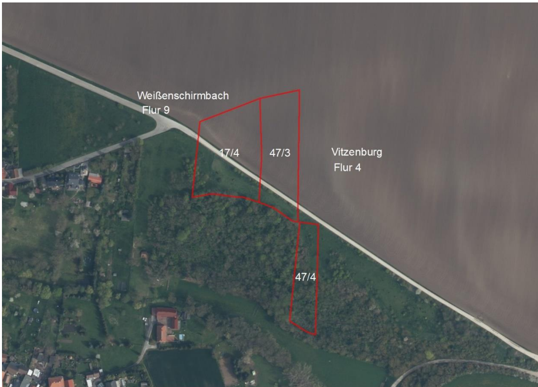
Übersichtskarte Vitzenburg und Weißenschirmbach

Geobasisdaten: © GeoBasis-DE / BKG (2026), Nutzungsbedingungen: http://sg.geodatenzentrum.de/web_public/nutzungsbedingungen.pdf ; © GeoBasis-DE / BKG 2018 (Daten verändert); www.bkg.bund.de ; Lageskizze