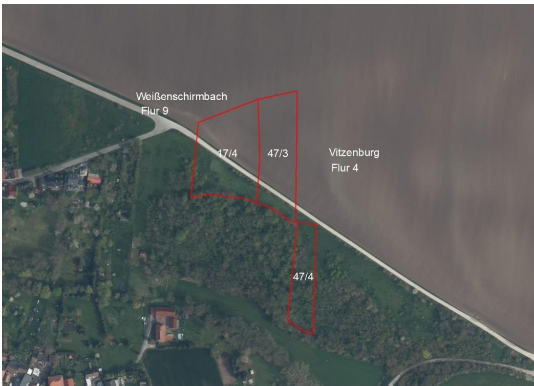
Übersichtskarte Vitzenburg und Weißenschirmbach

Geobasisdaten: © GeoBasis-DE / BKG (2026), Nutzungsbedingungen: http://sg.geodatenzentrum.de/web_public/nutzungsbedingungen.pdf , © GeoBasis-DE / BKG 2018 (Daten verändert), www.bkg.bund.de ; Lageskizze