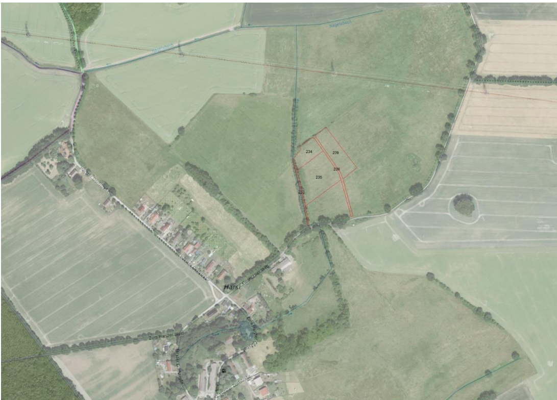
Gemarkungsgrenzen Basis. © Ämter für Geoinformation und Vermessung der Länder Mecklenburg-Vorpommern, Niedersachsen, Brandenburg, Berlin, Sachsen-Anhalt, Sachsen, Thüringen, © Bundesamt für Kartographie und Geodäsie (2026), Datenquellen: http://sg.geodatenzentrum.de/web_public/Datenquellen_TopPlus_Open.pdf , Geobasisdaten. © GeoBasis-DE / BKG (2026), Nutzungsbedingungen: http://sg.geodatenzentrum.de/web_public/nutzungsbedingungen.pdf , © GeoBasis-DE / BKG 2018 (Daten verändert), www.bkg.bund.de , Lagekizze