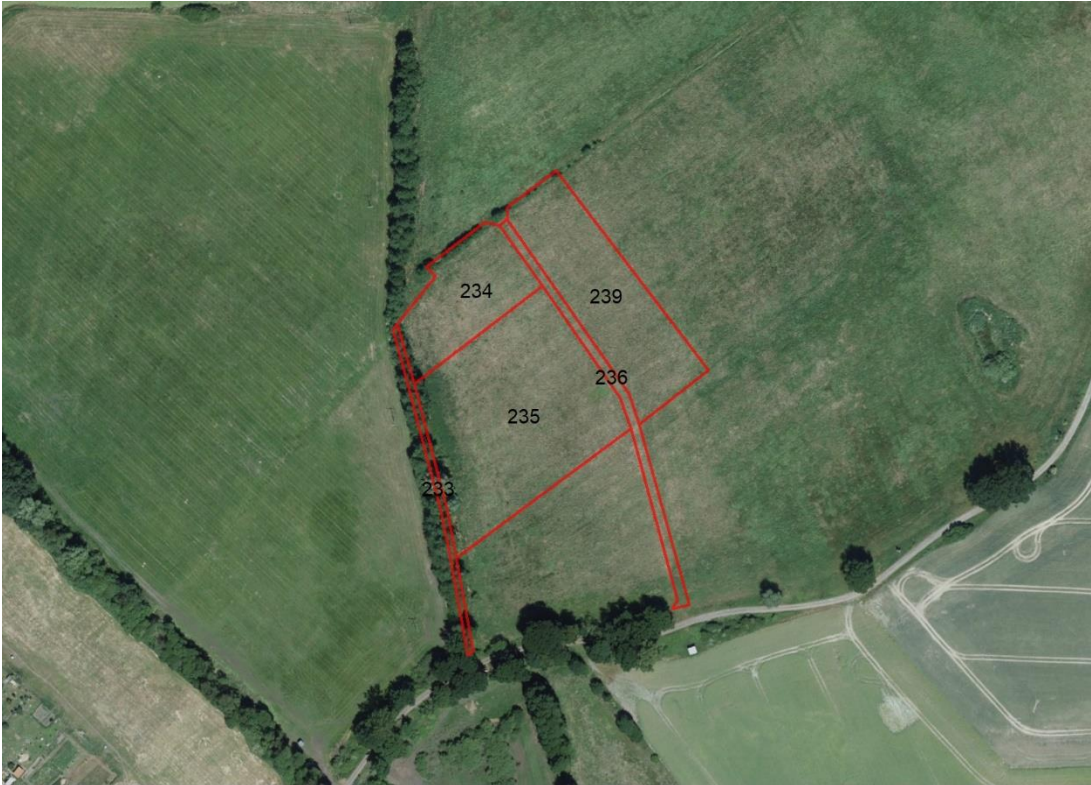
Gemarkungsgrenzen Basis. © Ämter für Geoinformation und Vermessung der Länder Mecklenburg-Vorpommern, Niedersachsen, Brandenburg, Berlin, Sachsen-Anhalt, Sachsen, Thüringen, Geobasisdaten. © GeoBasis-DE / BKG (2026). Nutzungsbedingungen: http://sg.geodatenzentrum.de/web_public/nutzungsbedingungen.pdf , © GeoBasis-DE / BKG 2018 (Daten verändert), www.bkg.bund.de , Lagekizze