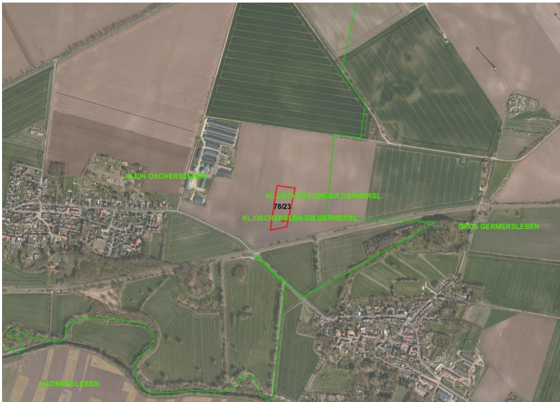
Objektübersicht - Luftbild

Gemarkungsgrenzen Basis. © Amt für Geoinformation und Vermessung der Länder Mecklenburg-Vorpommern, Niedersachsen, Brandenburg, Berlin, Sachsen-Anhalt, Sachsen, Thüringen, Basis: © Amt für Geoinformation und Vermessung der Länder Mecklenburg-Vorpommern, Niedersachsen, Brandenburg, Berlin, Sachsen-Anhalt, Sachsen, Thüringen, Geobasisdaten © GeoBasis-DE / BKG (2026), Nutzungsbedingungen: http://sg.geodatenzentrum.de/web_public/nutzungsbedingungen.pdf Lageskizze