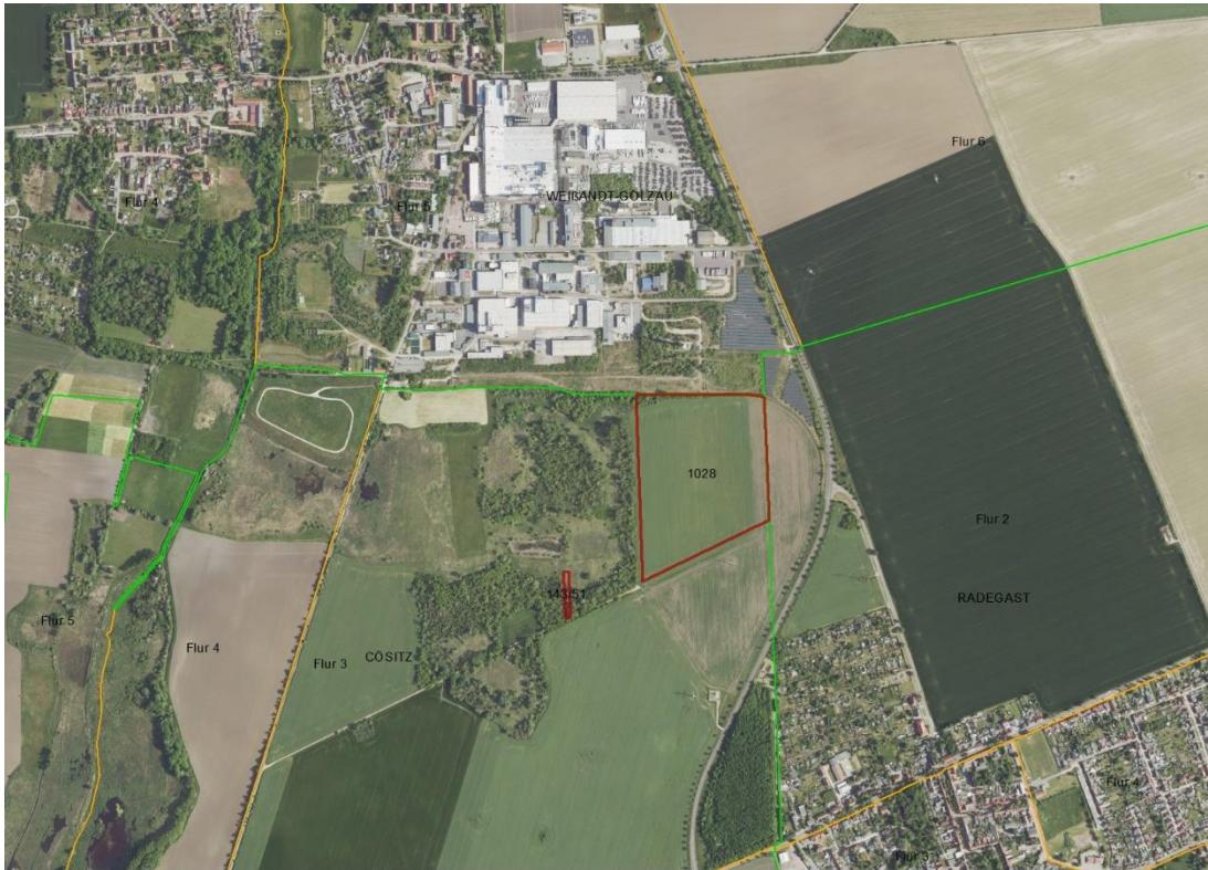
Gemarkungsgrenzen Lage-skizze