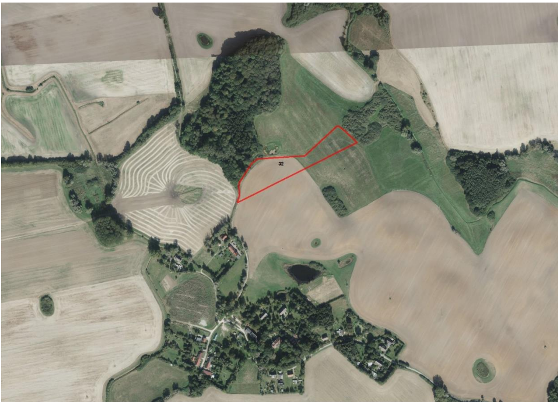
Luftbild - Flurstück 32

Lageskizze