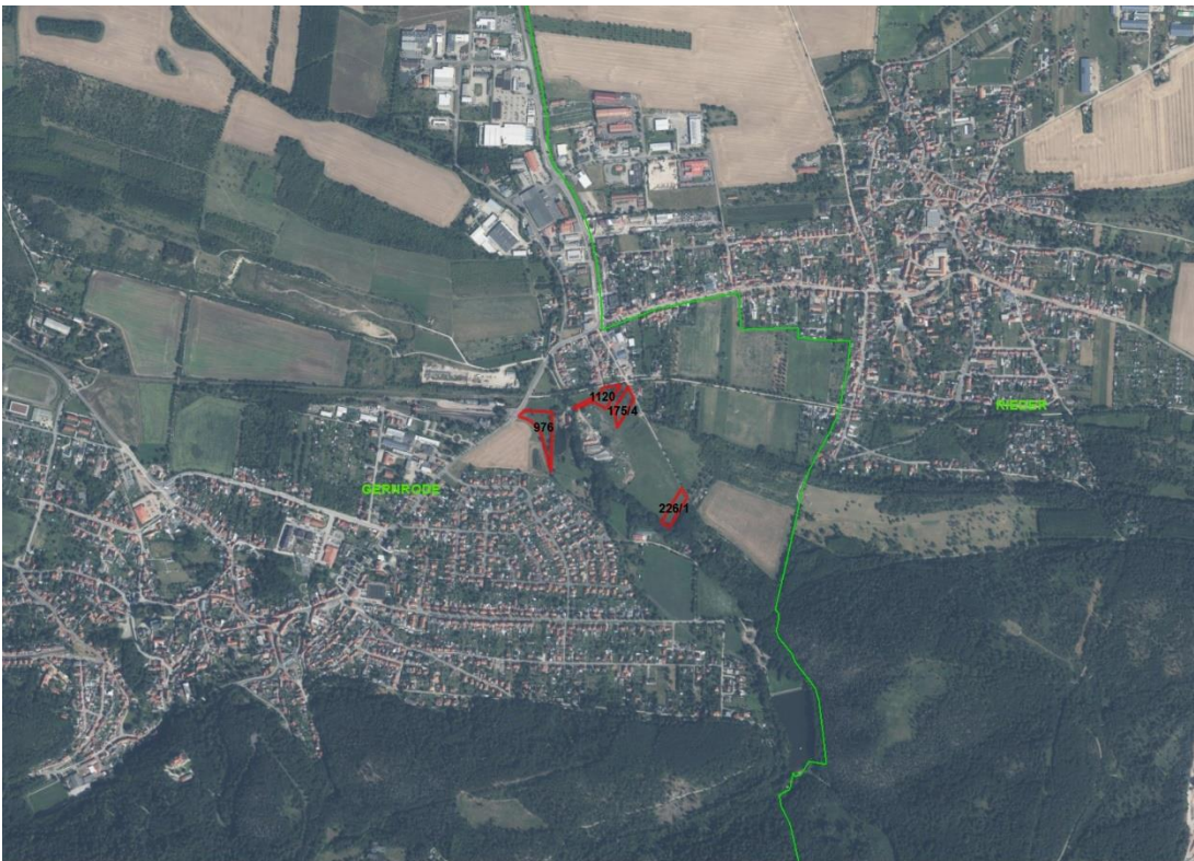
Objektübersicht - Luftbild

Gemarkungsgrenzen Basis: © Amtler für Geoinformation und Vermessung der Länder Mecklenburg-Vorpommern, Niedersachsen, Brandenburg, Berlin, Sachsen-Anhalt, Sachsen, Thüringen, Basis: © Amtler für Geoinformation und Vermessung der Länder Mecklenburg-Vorpommern, Niedersachsen, Brandenburg, Berlin, Sachsen-Anhalt, Sachsen, Thüringen, Geobasisdaten: © GeoBasis-DE / BKG (2026), Nutzungsbedingungen: http://sg.geodatenzentrum.de/web_public/nutzungsbedingungen.pdf , Lageskizze