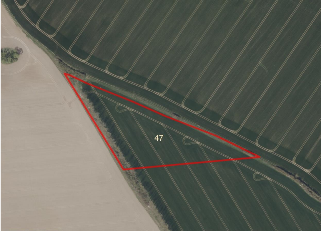
Geobasisdaten: © GeoBasis-DE / BKG (2026). Nutzungsbedingungen: http://sg.geodatenzentrum.de/web_public/nutzungsbedingungen.pdf . Lageskizze