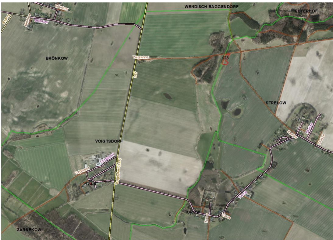
Gemarkungsgrenzen Basis: © Ämter für Geoinformation und Vermessung der Länder Mecklenburg-Vorpommern, Niedersachsen, Brandenburg, Berlin, Sachsen-Anhalt, Sachsen, Thüringen; Geobasisdaten © GeoBasis-DE / BKG (2026). Nutzungsbedingungen: http://sg.geodatenzentrum.de/web_public/nutzungsbedingungen.pdf ; © GeoBasis-DE / BKG 2024 (Daten verändert); http://sg.geodatenzentrum.de/web_public/nutzungsbedingungen.pdf ; © GeoBasis-DE / BKG 2018 (Daten verändert); www.bkg.bund.de , Lageskizze