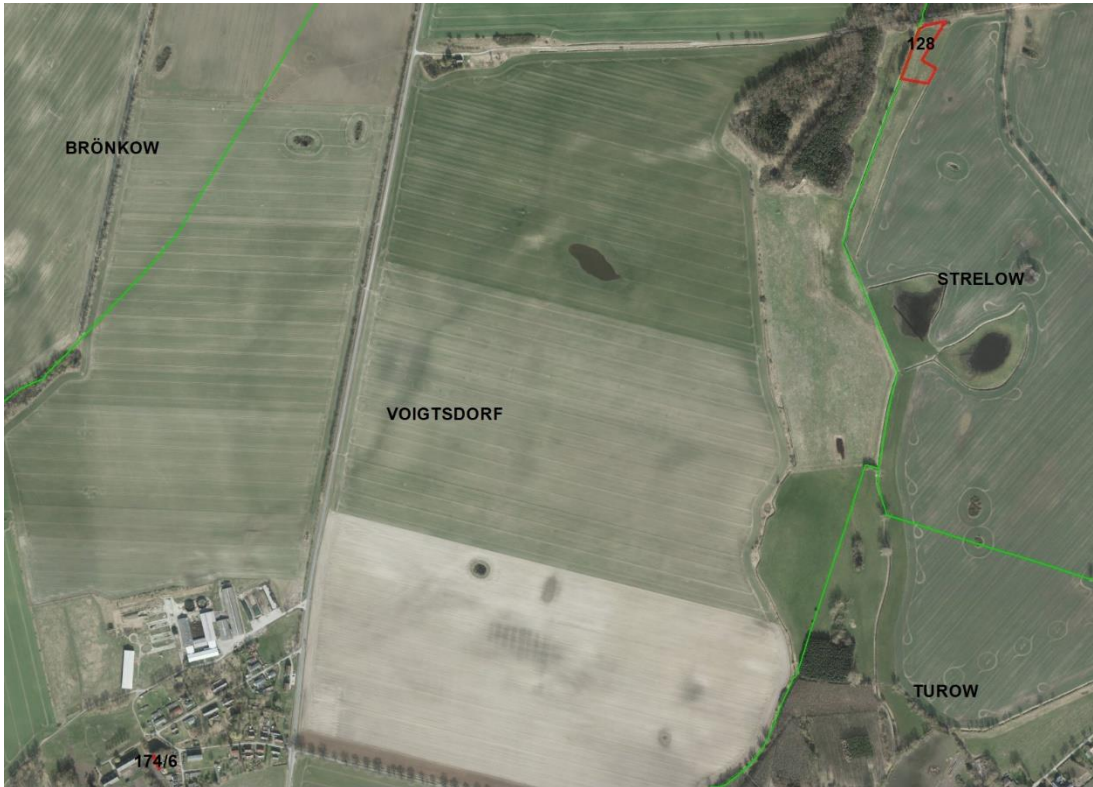
Gemarkungsgrenzen Basis: © Ämter für Geoinformation und Vermessung der Länder Mecklenburg-Vorpommern, Niedersachsen, Brandenburg, Berlin, Sachsen-Anhalt, Sachsen, Thüringen; Geobasisdaten © GeoBasis-DE / BKG (2026). Nutzungsbedingungen: http://sg.geodatenzentrum.de/web_public/nutzungsbedingungen.pdf ; © GeoBasis-DE / BKG 2018 (Daten verändert); www.bkg.bund.de , Lageskizze