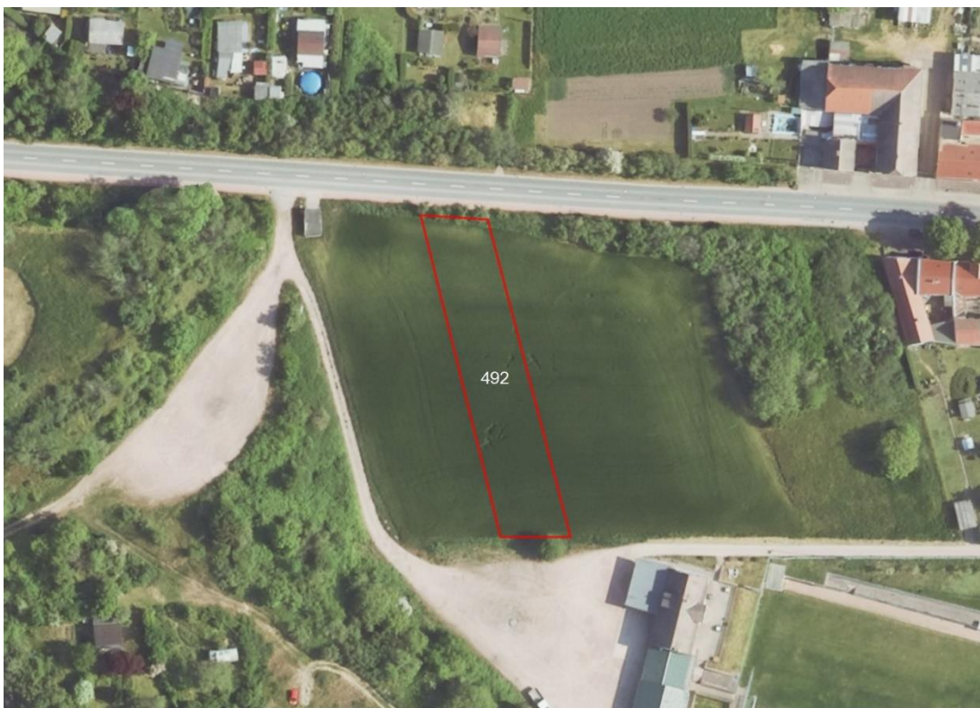
Detailansicht Löbejün Flur 5