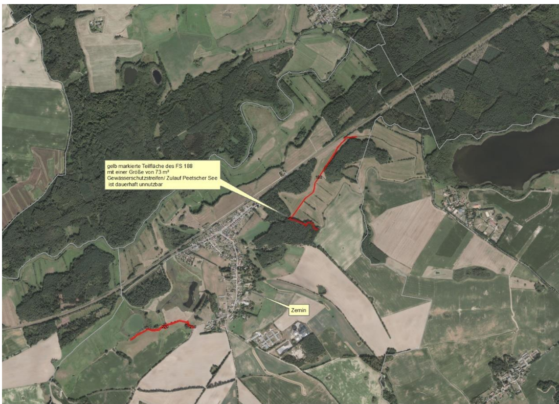
Luftbild BVVG GIS

Geobasisdaten: © GeoBasis-DE / BKG (2026). Nutzungsbedingungen: http://sg.geodatenzentrum.de/web_public/nutzungsbedingungen.pdf . © GeoBasis-DE / BKG 2018 (Daten verändert). www.bkg.bund.de . Lageskizze