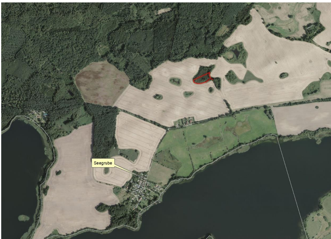
Luftbild BVVG GIS

Geobasisdaten: © GeoBasis-DE / BKG (2026). Nutzungsbedingungen: http://sg.geodatenzentrum.de/web_public/nutzungsbedingungen.pdf . © GeoBasis-DE / BKG 2018 (Daten verändert). www.bkg.bund.de . Lageskizze