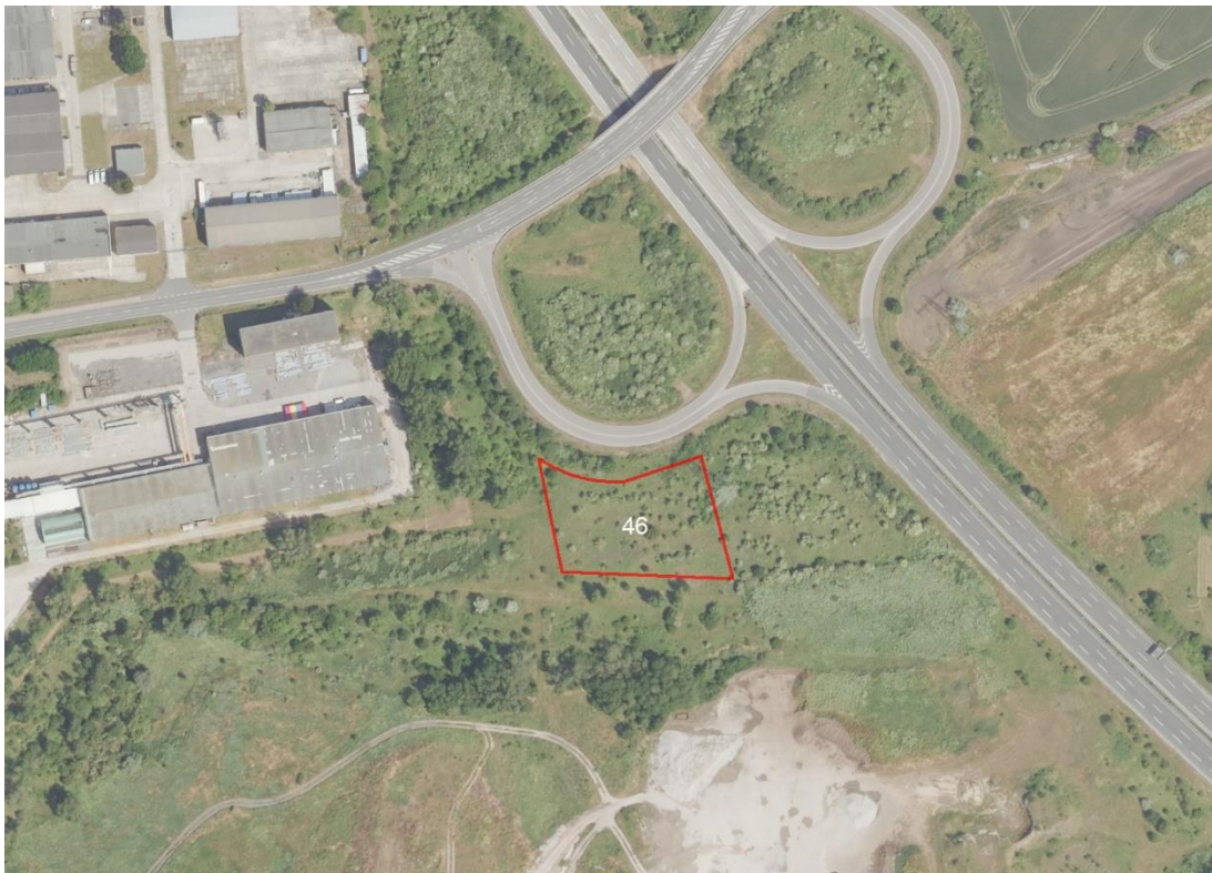
Übersichtskarte Frankleben und Neumark

Geobasisdaten: © GeoBasis-DE / BKG (2026), Nutzungsbedingungen: http://sg.geodatenzentrum.de/web_public/nutzungsbedingungen.pdf ; © GeoBasis-DE / BKG 2018 (Daten verändert); www.bkg.bund.de ; Lageskizze