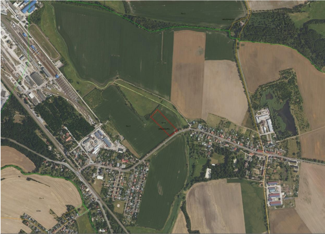
Gemarkungsgrenzen Basis. © Ämter für Geoinformation und Vermessung der Länder Mecklenburg-Vorpommern, Niedersachsen, Brandenburg, Berlin, Sachsen-Anhalt, Sachsen, Thüringen, Geobasisdaten © GeoBasis-DE / BKG (2026), Nutzungsbedingungen: http://sg.geodatenzentrum.de/web_public/nutzungsbedingungen.pdf , © GeoBasis-DE / BKG 2018 (Daten verändert), www.bkg.bund.de , Lage-skizze