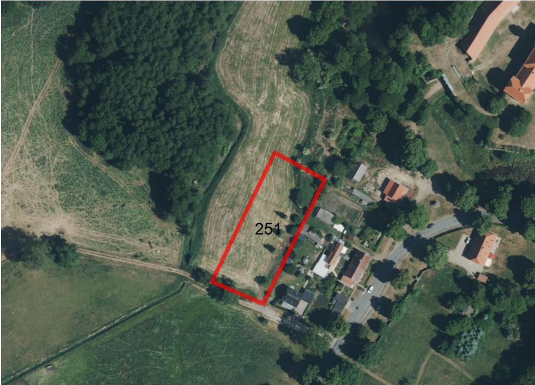
Geobasisdaten: © GeoBasis-DE / BKG (2026). Nutzungsbedingungen: http://sg.geodatenzentrum.de/web_public/nutzungsbedingungen.pdf . © GeoBasis-DE / BKG 2018 (Daten verändert), www.bkg.bund.de ; Lageskizze