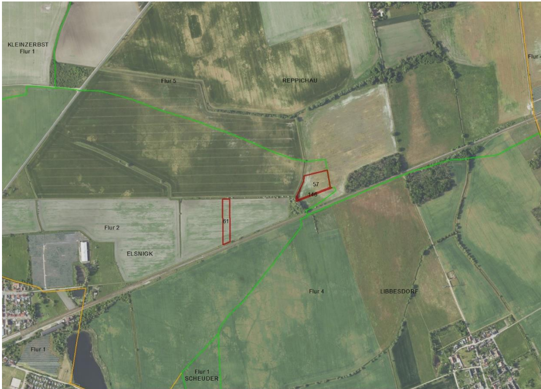
Gemarkungsgrenzen Basis. © Ämter für Geoinformation und Vermessung der Länder Mecklenburg-Vorpommern, Niedersachsen, Brandenburg, Berlin, Sachsen-Anhalt, Sachsen, Thüringen, Basis: © Ämter für Geoinformation und Vermessung der Länder Mecklenburg-Vorpommern, Niedersachsen, Brandenburg, Berlin, Sachsen-Anhalt, Sachsen, Thüringen, Geobasisdaten: © GeoBasis-DE / BKG (2026), Nutzungsbedingungen: http://sg.geodatenzentrum.de/wb_public/nutzungsbedingungen.pdf , Lageskizze