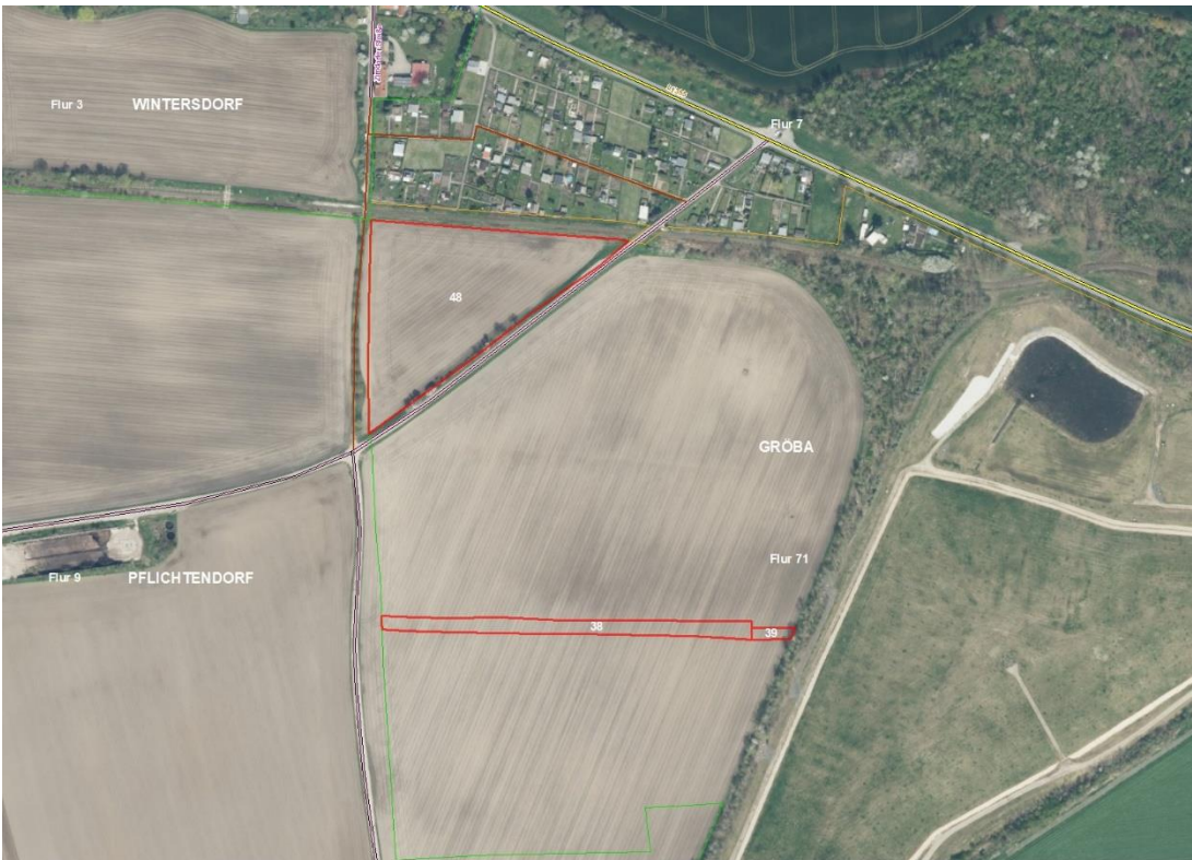
Gemarkung Gröba, Flur 71, FS 28, 38, 39, 48

Gemarkungsgrenzen Basis: © Ämter für Geoinformation und Vermessung der Länder Mecklenburg-Vorpommern, Niedersachsen, Brandenburg, Berlin, Sachsen-Anhalt, Sachsen, Thüringen; Geobasisdaten © Geobasis-DE / BKG (2026). Nutzungsbedingungen: http://sg.geodatenzentrum.de/web_public/nutzungsbedingungen.pdf , © GeoBasis-DE / BKG 2024 (Daten verändert), http://www.bkg.bund.de , Lageskizze