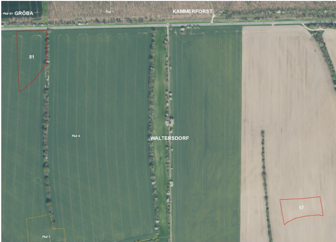
Gemarkungsgrenzen Basis: © Ämter für Geoinformation und Vermessung der Länder Mecklenburg-Vorpommern, Niedersachsen, Brandenburg, Berlin, Sachsen-Anhalt, Sachsen, Thüringen, Basis: © Ämter für Geoinformation und Vermessung der Länder Mecklenburg-Vorpommern, Niedersachsen, Brandenburg, Berlin, Sachsen-Anhalt, Sachsen, Thüringen, Geobasisdaten: © GeoBasis-DE / BKG (2026), Nutzungsbedingungen: http://sg.geodatenzentrum.de/w/eb_public/nutzungsbedingungen.pdf ; Lageskizze