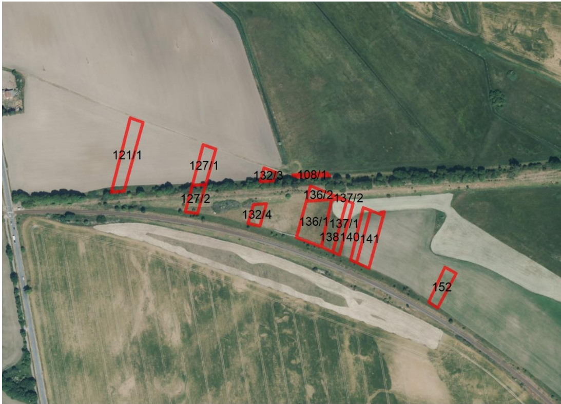
Geobasisdaten: © GeoBasis-DE / BKG (2026). Nutzungsbedingungen: http://sg.geodatenzentrum.de/web_public/nutzungsbedingungen.pdf . Lageskizze