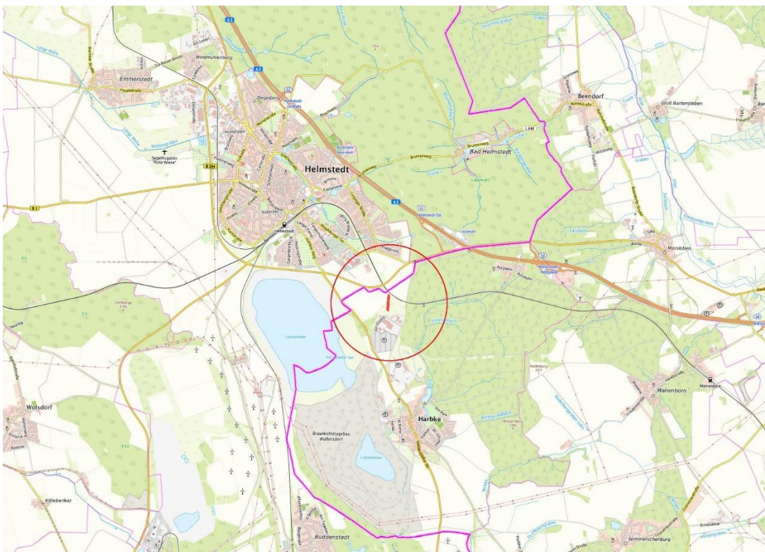
© Bundesamt für Kartographie und Geodäsie (2026). Datenquellen: http://sg.geodatenzentrum.de/web_public/Datenquellen_TopPlus_Open.pdf ; © GeoBasis-DE / BKG 2018 (Daten verändert); www.bkg.bund.de; Lageskizze