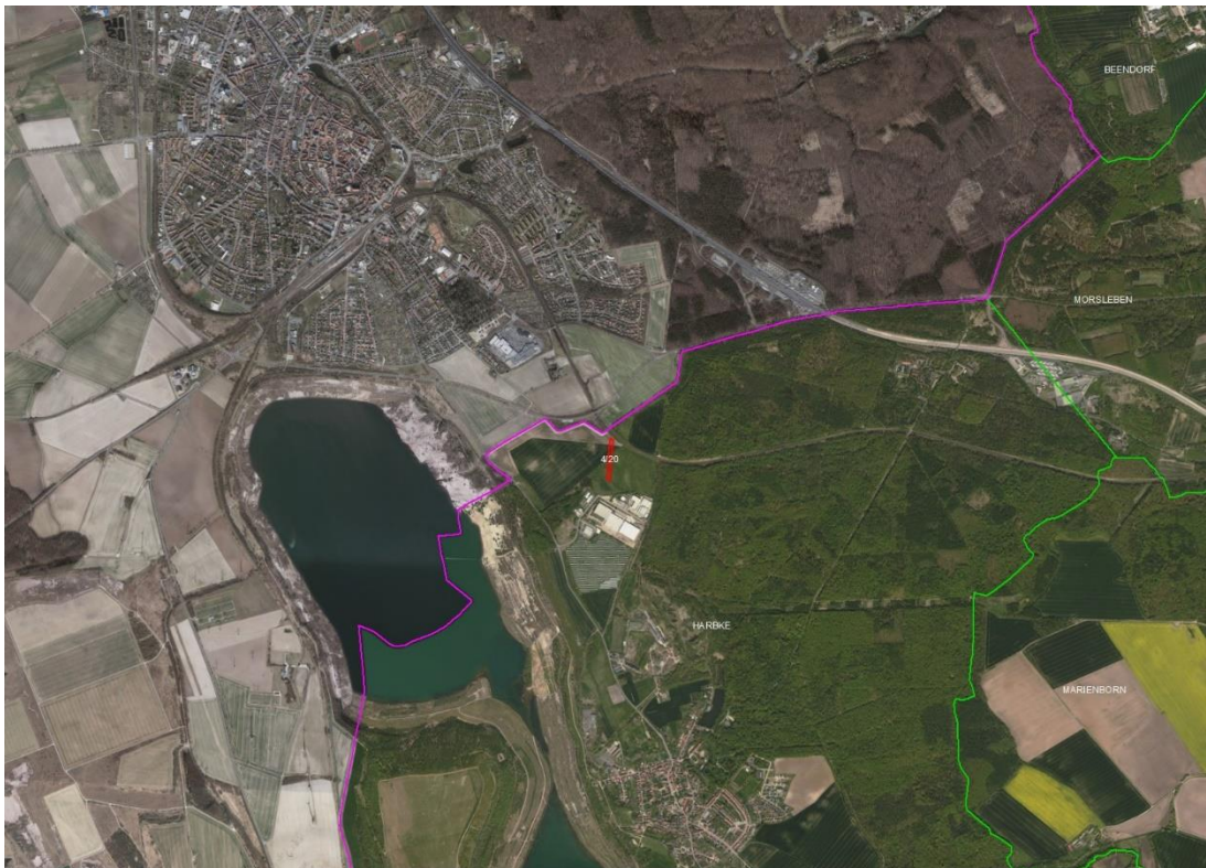
Harbke, Flur 1

Gemarkungsgrenzen Basis: © Ämter für Geoinformation und Vermessung der Länder Mecklenburg-Vorpommern, Niedersachsen, Brandenburg, Berlin, Sachsen-Anhalt, Sachsen, Thüringen; Geobasisdaten © GeoBasis-DE / BKG (2026). Nutzungsbedingungen: http://sg.geodatenzentrum.de/web_public/nutzungsbedingungen.pdf ; © GeoBasis-DE / BKG 2018 (Daten verändert); www.bkg.bund.de , Lageskizze