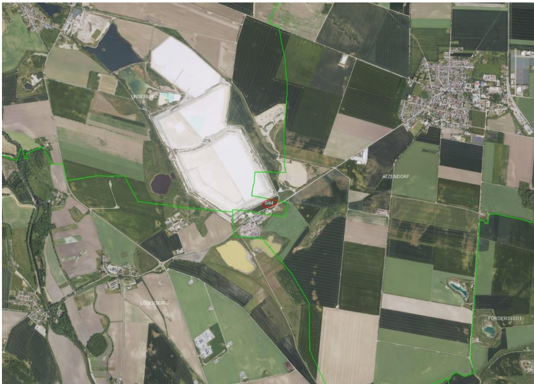
Objektübersicht - Luftbild

Gemarkungsgrenzen Basis: © Ämter für Geoinformation und Vermessung der Länder Mecklenburg-Vorpommern, Niedersachsen, Brandenburg, Berlin, Sachsen-Anhalt, Sachsen, Thüringen, Geobasisdaten © GeoBasis-DE / BKG (2026), Nutzungsbedingungen: http://sg.geodatenzentrum.de/web_public/nutzungsbedingungen.pdf , © GeoBasis-DE / BKG 2018 (Daten verändert), www.bkg.bund.de , Lageskizze